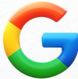
جميع اعلانات جوجل